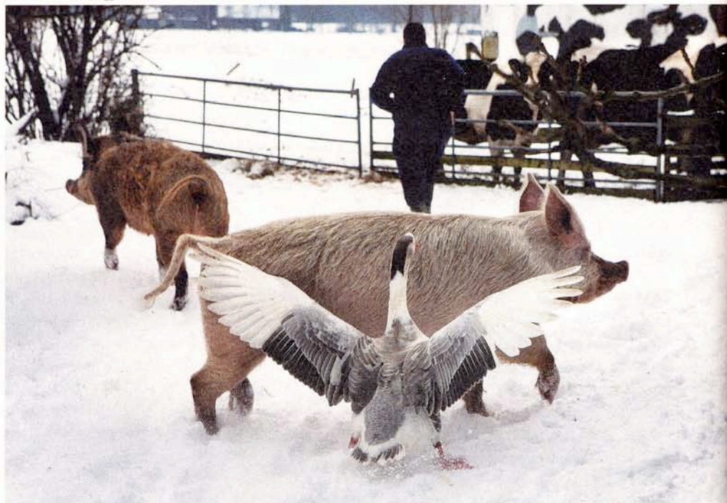
Vrouw Vos, Aagje en Arie Bombarie.

komen, die eens in de drie weken berig zijn, brak hij los, vernielde een paar ramen, sloopte de houten staldeur en rukte een gasleiding stuk. Ook het vrouwtje zelf kon een paar dagen later maar net het vege lijf redden voor de hormonale orkaan.