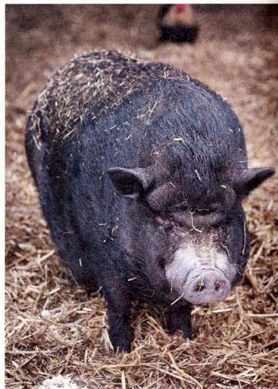
Het hangbuikzwijn Mannetje Bromsnor.